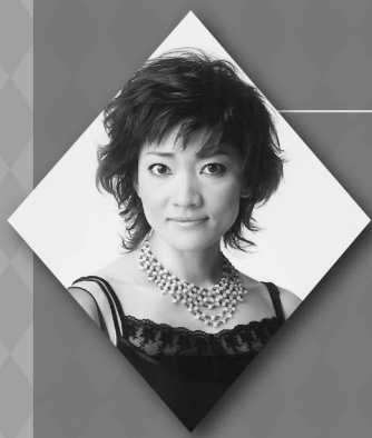
女優：島田 歌穂 Kaho Shimada

'74年、子役デビュー。'87年「レ・ミゼラブル」で脚光を浴び、出演回数は1,000回を超えた。同作の世界ベストキャストに選ばれ、英国王室主催の御前コンサートに出演。参加したベストキャストアルバムが米国にてグラミー賞を受賞。 主な出演作品は「黙阿弥オペラ」「ウエストサイド・ストーリー」「飢餓海峡」「江利チエミ物語」など多数。女優、歌手として、舞台やコンサートなどに幅広く活躍。 芸術選奨文部大臣新人賞、紀伊國屋演劇賞個人賞、読売演劇大賞優秀女優賞など受賞多数。大阪芸術大学教授。