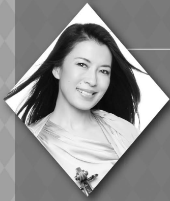
ヴァイオリニスト／作曲家：川井 郁子 Ikuko Kawai

'74年、子役デビュー。'87年「レ・ミゼラブル」で脚光を浴び、出演回数は1,000回を超えた。同作の世界ベストキャストに選ばれ、英国王室主催の御前コンサートに出演。参加したベストキャストアルバムが米国にてグラミー賞を受賞。 主な出演作品は「黙阿弥オペラ」「ウエストサイド・ストーリー」「飢餓海峡」「江利チエミ物語」など多数。女優、歌手として、舞台やコンサートなどに幅広く活躍。 芸術選奨文部大臣新人賞、紀伊國屋演劇賞個人賞、読売演劇大賞優秀女優賞など受賞多数。大阪芸術大学教授。