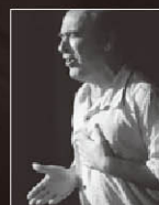
アギラル・デ・ヘレス Aguilar de Jerez